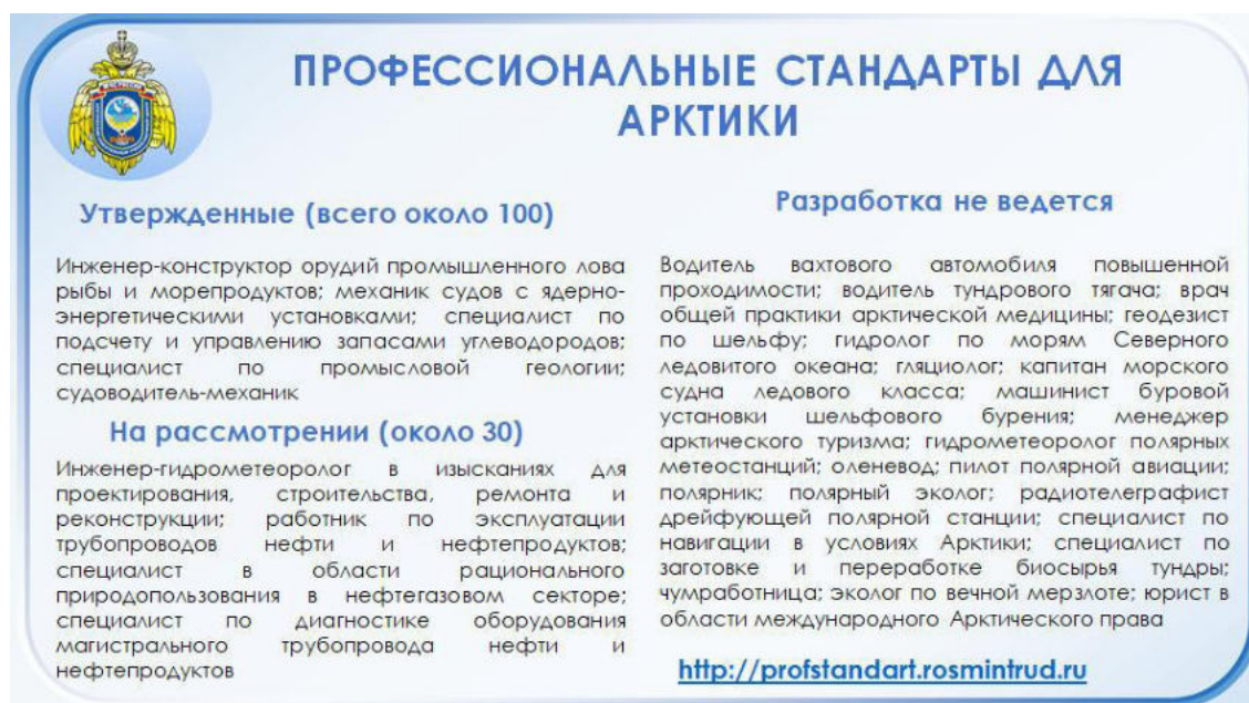
Рисунок 1 – Профессиональные стандарты для Арктики

В настоящее время соответствующая работа по разработке профстандартов по профессиям и специальностям, представляющим интерес для предприятий, осуществляющих деятельность в районах Крайнего Севера и на территории Арктической зоны Российской Федерации проводится Координационным советом Российского союза промышленников и предпринимателей по развитию Северных территорий и Арктики, рис. 1.